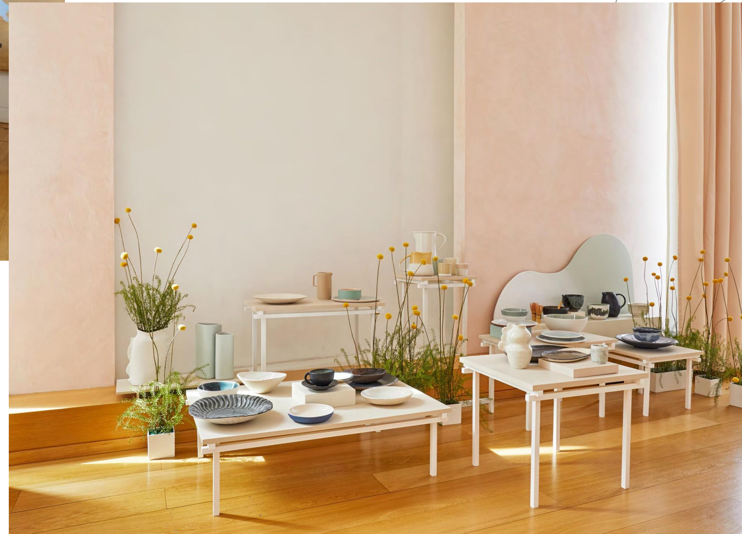
INSZENIERTER RAUM ▶ von Jars