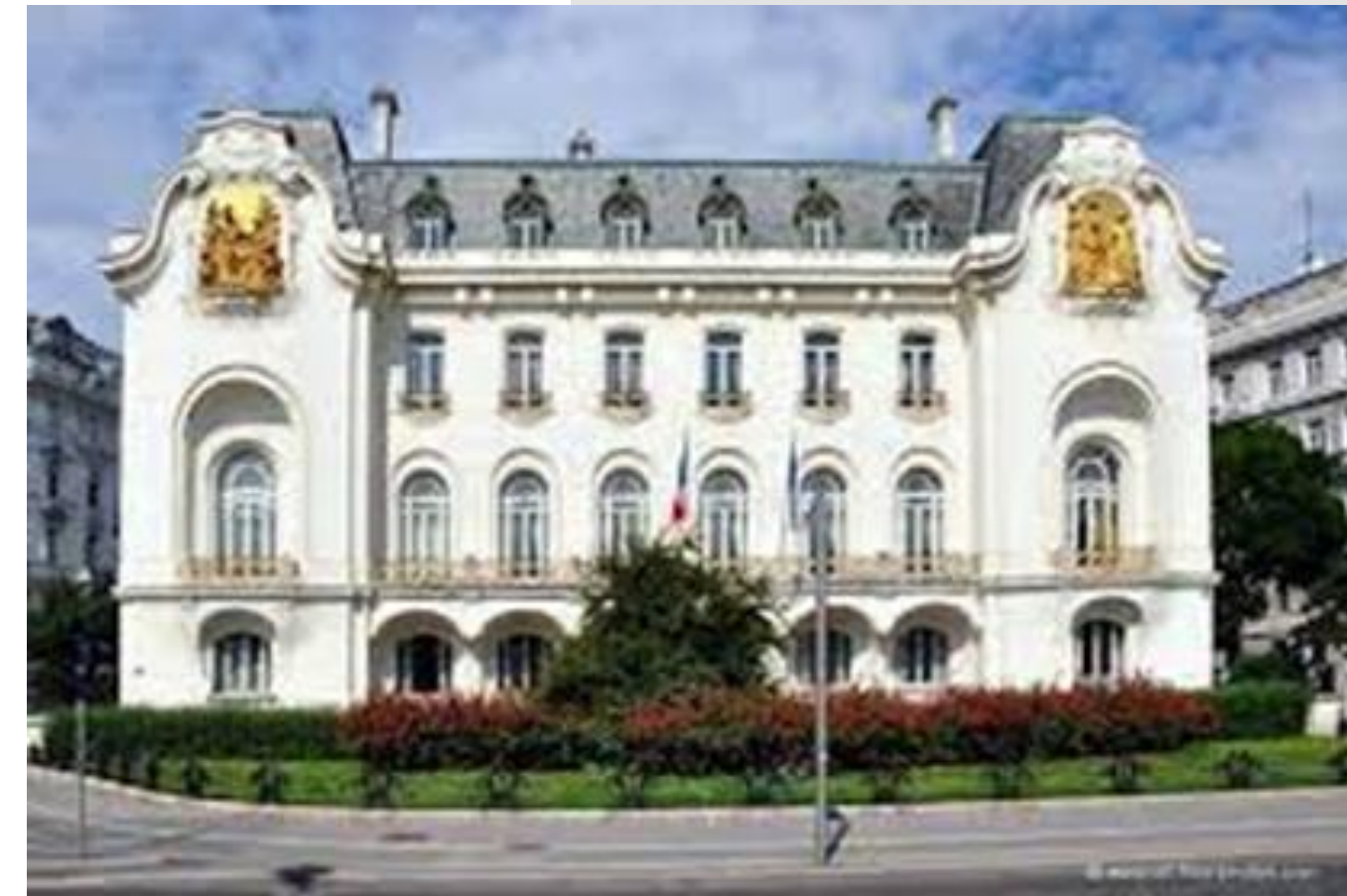
Technikerstraße 2 1040 Wien Österreich

Dieses elegante Gebäude als außergewöhnliches Zeugnis des französischen „Art Nouveau“ zu erhalten ist ein besonderes Anliegen der französischen Botschaft in Wien und der speziell zur Pflege des Kulturerbes eingerichteten Abteilungen des Außenministeriums.