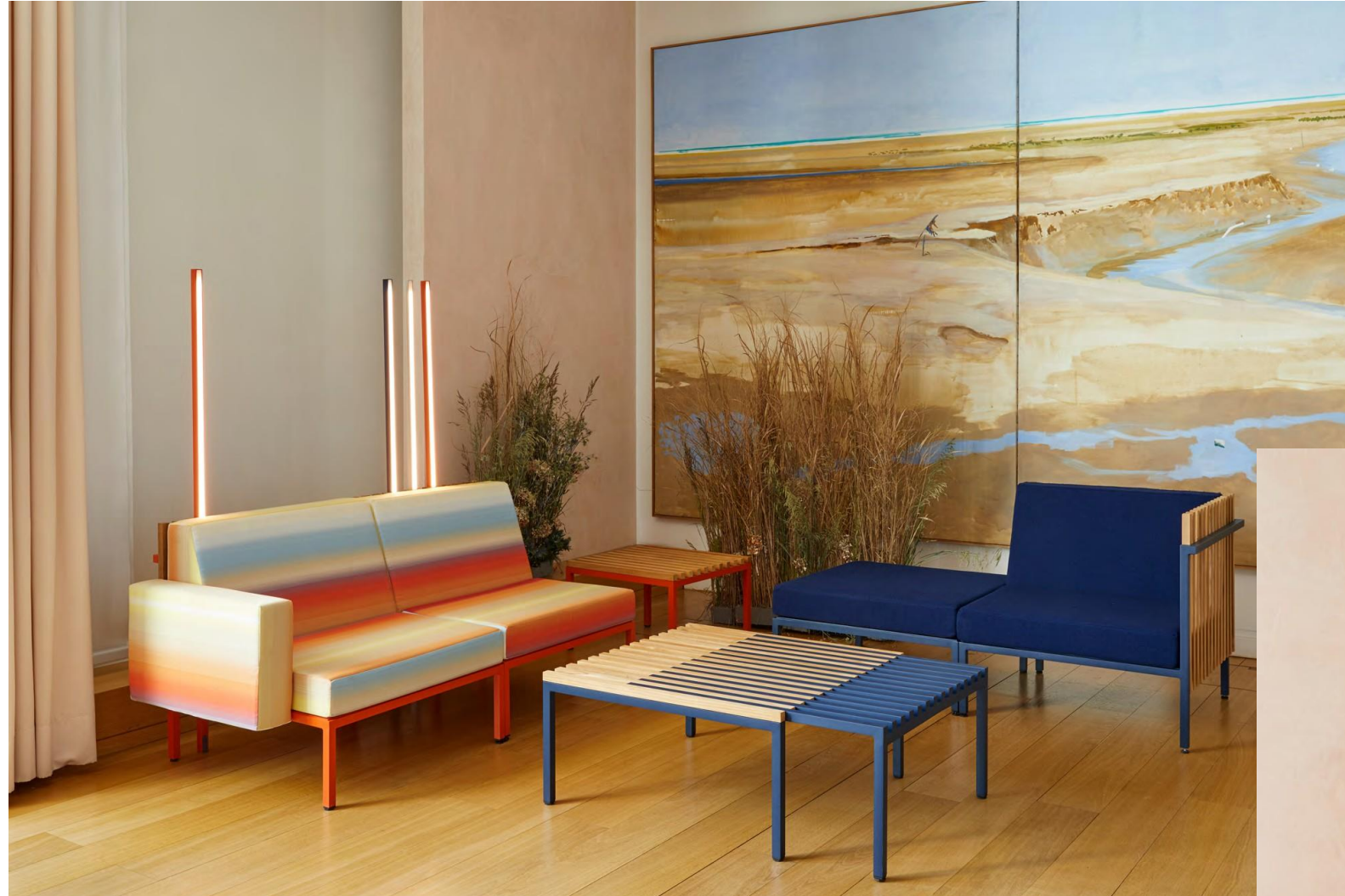
◀ INSZENIERTER RAUM von EGO Paris